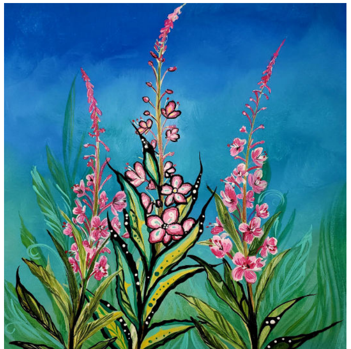
Illustration par Karen Erickson

Les frais d'hébergement et de déplacement doivent être couverts par votre organisme. Veuillez noter que le nombre de places est limité à 35 personnes, et que notre processus de sélection tiendra compte des objectifs en matière de diversité et d'inclusion.